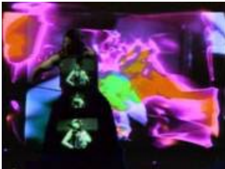
Nam June Paik /Global Groove

Artistas que pueden "como dato" verse como referencia en producciones de la década del 70, la obra Global Groove del recientemente fallecido Nam June Paik, o las videoperformances de Vitto Aconcci.