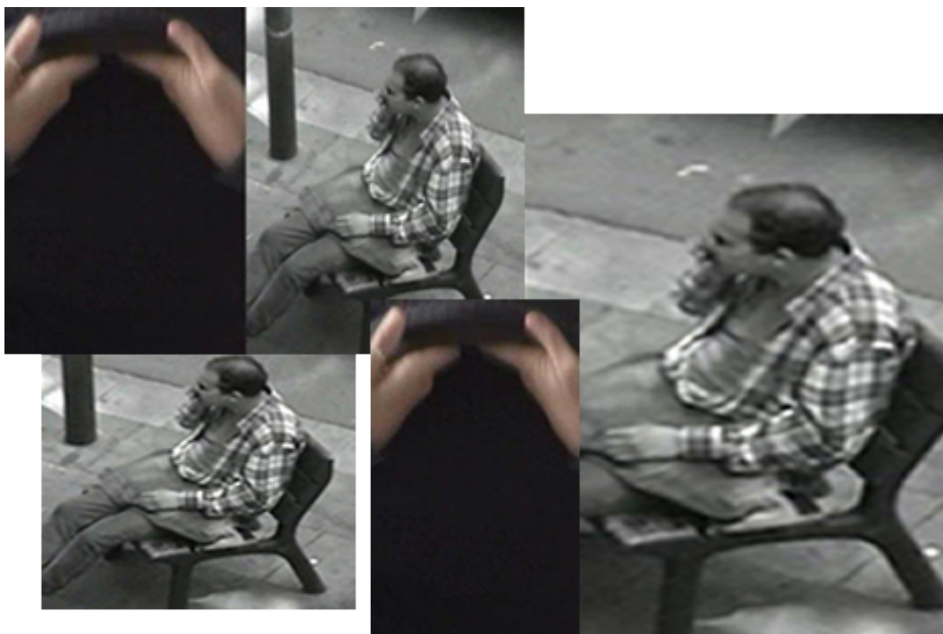
CAIDA LIBRE / Brisa MP Ejercicios Urbanos Barcelona, 2006

Por lo general estas producciones las realizan artistas independientes que autogestionan sus propios proyectos, coherentemente con el medio que utilizan no son producciones que abarquen grandes costos de producción, ya que más que su implicancia formal, el sentido de investigación y experimentación son prioritarios.